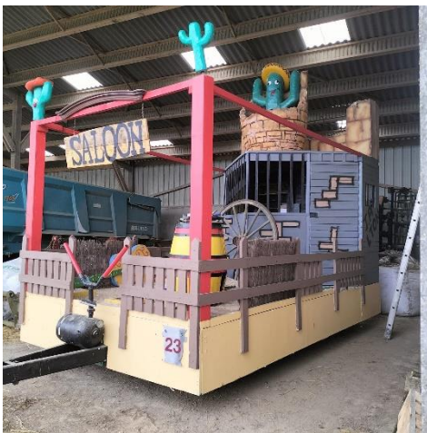
Char des jeunes agriculteurs de Vitré Pour le carnaval du dimanche 24 mars et du samedi 6 avril (nocturne)